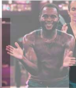
Une voix féminine omniprésente