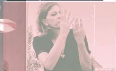
Des étreintes inattendues